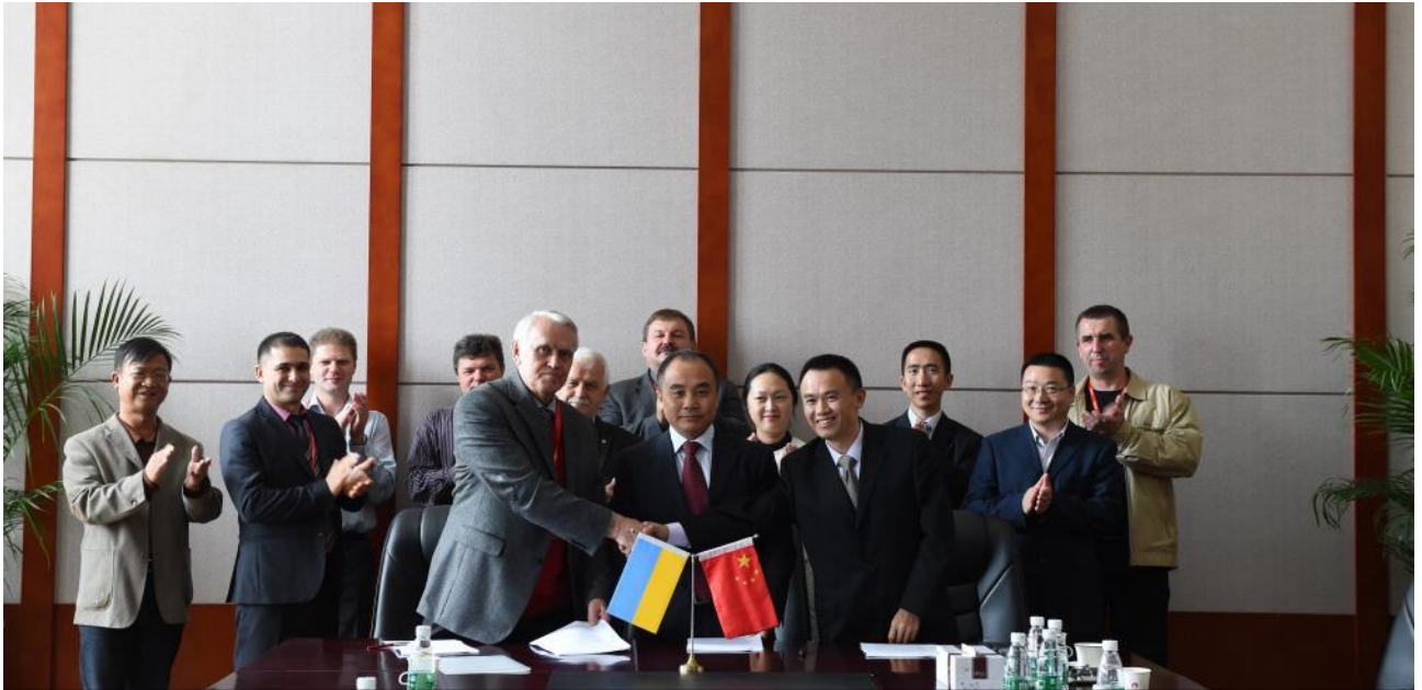
Підписання контракту між фахівцями Інституту прикладної фізики НАН України та Інституту ядерної енергії КНР (27 жовтня 2015 року, м. Ченду, КНР)

Наприкінці жовтня 2015 року на запрошення Інституту ядерної енергії КНР делегація вчених Інституту прикладної фізики (ІПФ) НАН України (м. Суми) на чолі з директором установи академіком В.Ю. Сторіжком взяла участь в обговоренні перспективних напрямів наукового співробітництва в галузі створення реакторів наступного покоління.